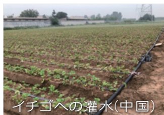
イチゴへの灌水(中国)

中国、モンゴル、韓国、タイ、 ベトナム、カンボジア、インド、 イラン、デンマーク、ノルウェー、 カナダ、メキシコ、チリ・・・ 世界各国に広がっています。