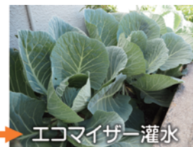
エコマイザー灌水